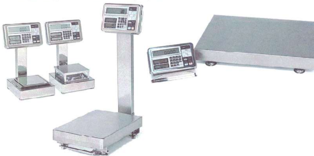
Рисунок 1 - Общий вид весов неавтоматического действия FS, FZ

Весы снабжены следующими устройствами и функциями (в скобках указаны соответствующие пункты ГОСТ OIML R 76-1-2011):