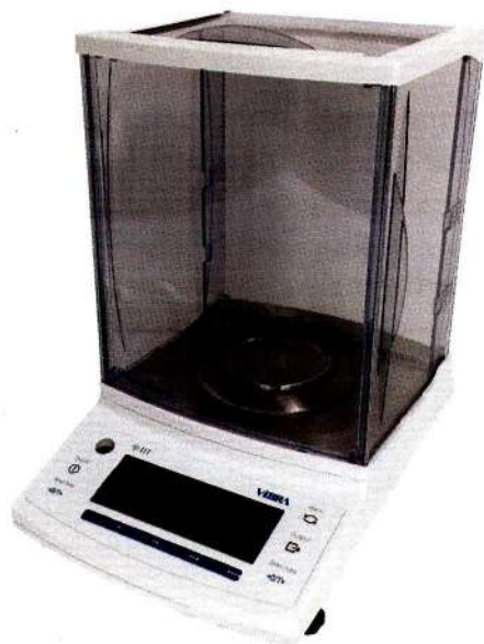
Рисунок 1 – Общий вид весов неавтоматического действия НТ

Принцип действия весов основан на преобразовании изменения частоты вибрации акустического весоизмерительного датчика, возникающего при его деформации под действием силы тяжести объекта измерений, в цифровой электрический сигнал, изменяющийся пропорционально массе объекта измерений.