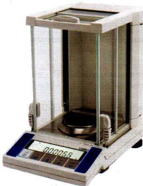
Рисунок 1 - Общий вид весов неавтоматического действия АФ.

Принцип действия весов основан на компенсации массы взвешиваемого груза электромагнитной силой, создаваемой системой автоматического уравнивания. Электрический сигнал, изменяющийся пропорционально массе взвешиваемого груза, преобразуется в цифровой код. Результаты взвешивания выводятся на дисплей.