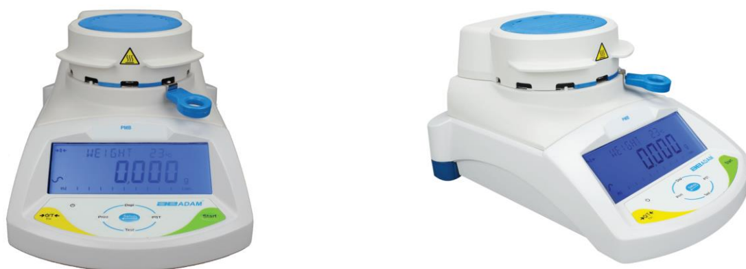
Рисунок 1 – Общий вид анализатора